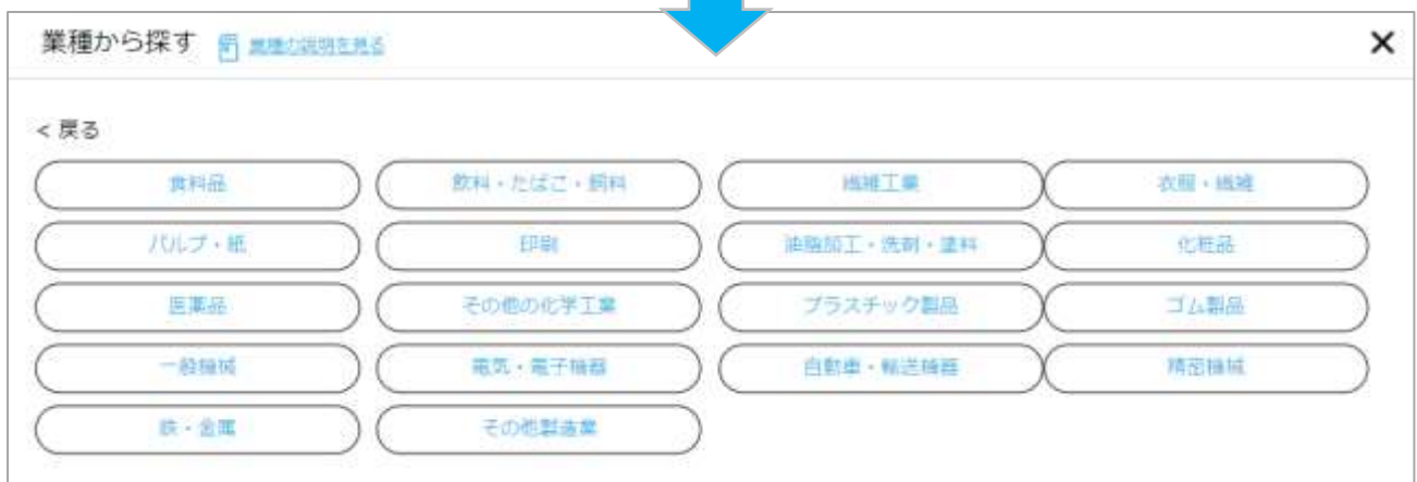
PC版 検索項目イメージ① (就職先検索機能)