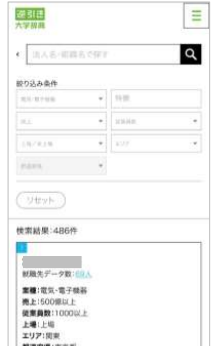
スマートフォン版画面イメージ（就職先検索機能）