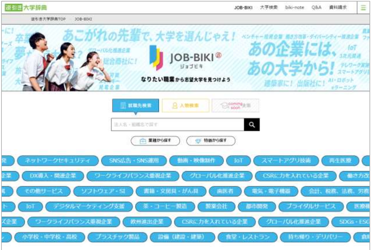
PC版トップ画面イメージ