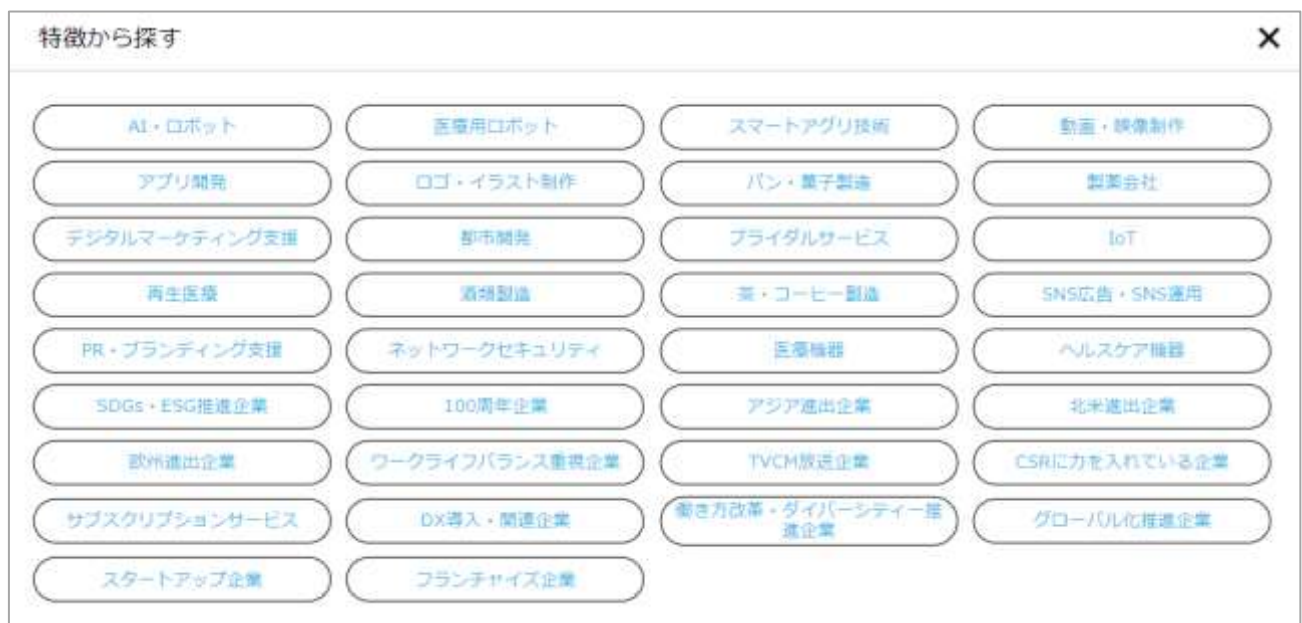
PC版 検索項目イメージ② (就職先検索機能)