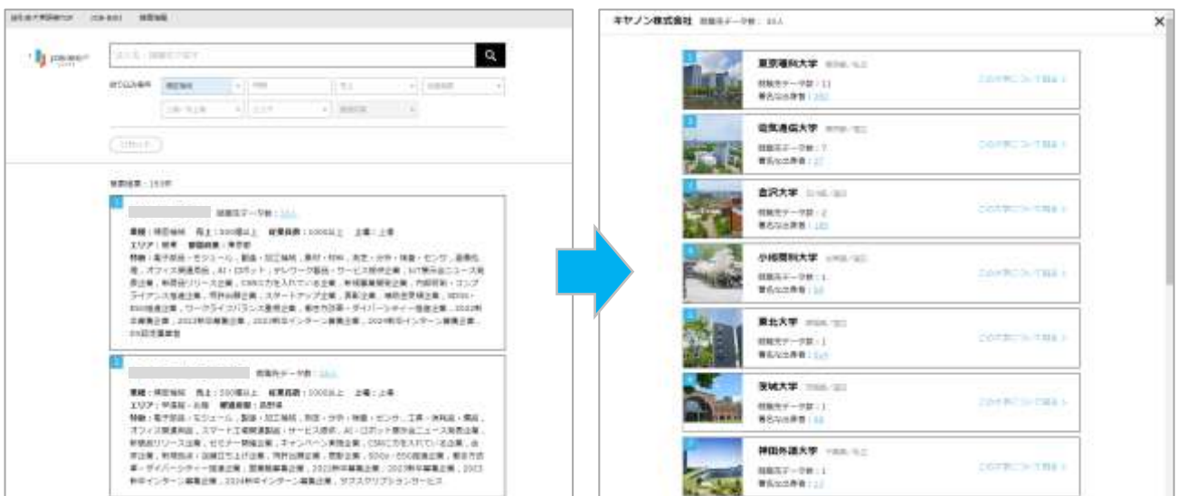
PC版 検索結果イメージ（就職先検索機能）