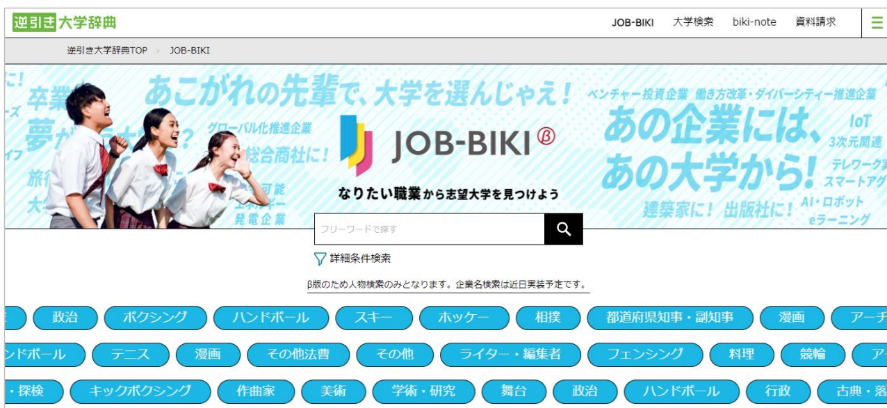
PC版・画面イメージ