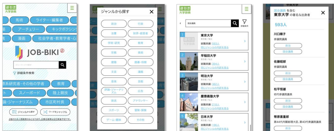
スマホ版・画面イメージ